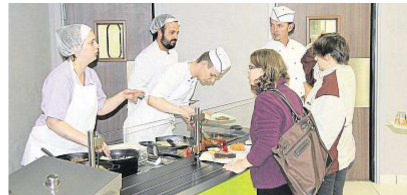
L'ancienne cantine Moulinex de Falaise a été transformée en restaurant inter-entreprises par l'Esat l'Essor. Les clients sont accueillis depuis le début du mois.

A Argentan , une dizaine de personnes se réunissent chaque semaine ( Ouest-France de jeudi).