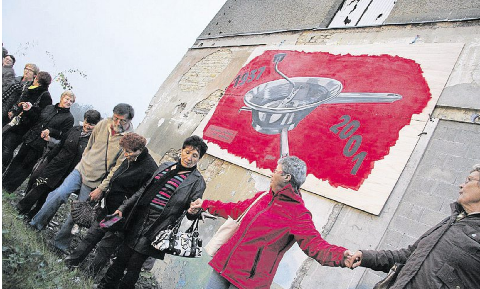
Mardi 8 novembre 2011. Cent salariés forment une chaîne humaine autour de la cathédrale qu'ils espèrent voir devenir « espace mémoire ouvrière industrielle et sociale ».

La priorité c'est d'accompagner les gens vers l'emploi. Il faut aussi